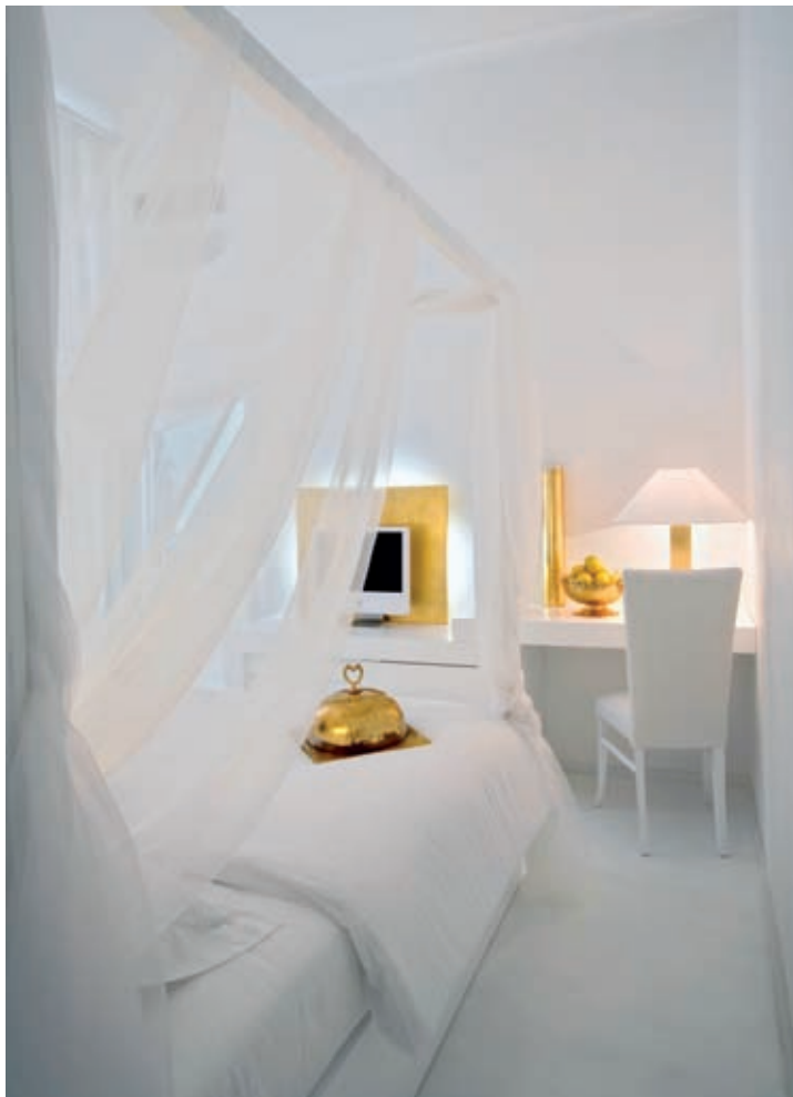
Bianco dominante nelle 39 camere, dove ogni dettaglio è nel purissimo e candido colore