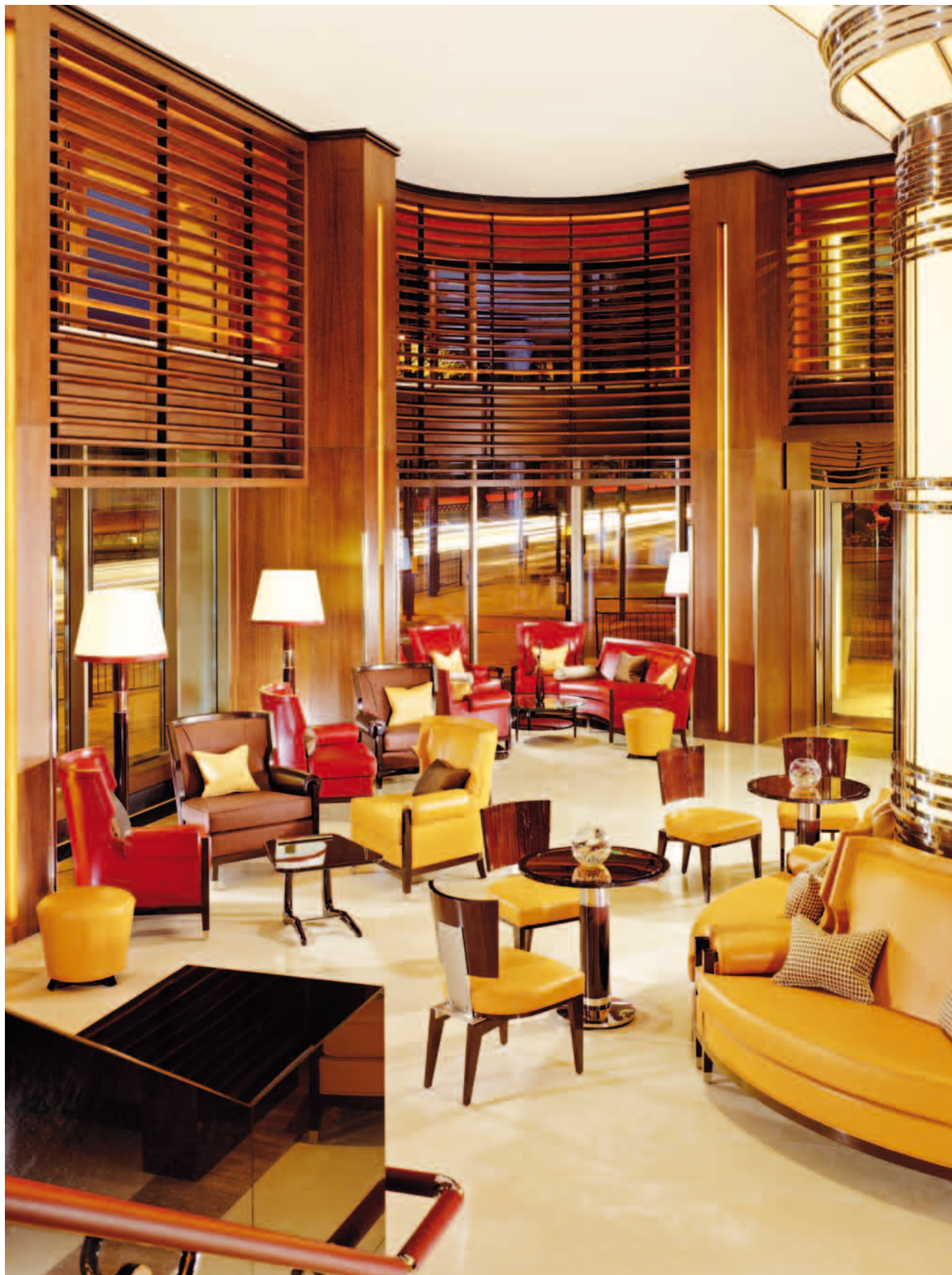
La raffinata zona lounge del piano terra, con i suoi 36 posti a sedere, le poltrone in pelle color senape, più scure o in rosso pompeiano, che si stagliano sui pavimenti in marmo chiaro. È caratterizzata da una doppia altezza e da boiserie in legno ambrato. Una scala in marmo scuro conduce al lounge del mezzanino