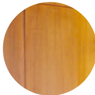
Boiserie in legno ambrato