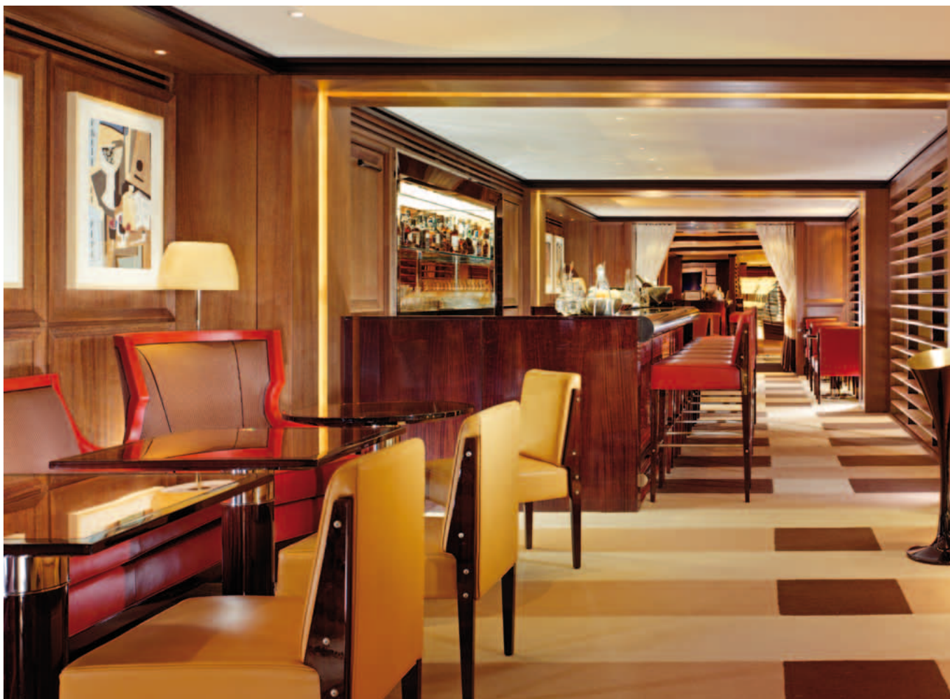
Nel piano mezzanino trovano posto una library, una media room attrezzata Bang & Olufsen, una zona fitness e il Bar 45. Qui gli ambienti sono caratterizzati dal legno, dal cuoio rosso delle sedute e dal vetro dei tavolini