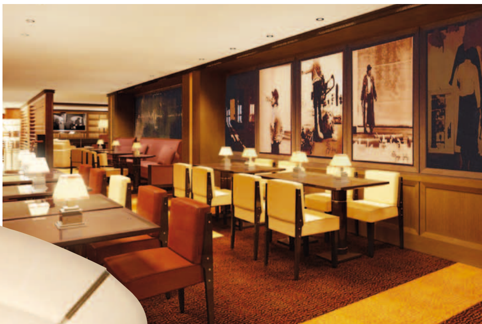
Il Bar 45. Gli ambienti sono caratterizzati da legno, dal cuoio rosso e panna delle sedute e dalle opere d'arte

volgono e sembrano contenere la facciata. Il tema del controllo della luce solare è riproposto anche al piano terra, elegantemente sottolineato da una raggiera in acciaio che sovrasta l'impennata a doppia altezza delle finestre, che costituisce lo zoccolo dell'edificio. La caratterizzazione del piano terra è controbilanciata dall'aggetto molto aereo dell'ultimo piano che forma i balconi e il terrazzo della penthouse.