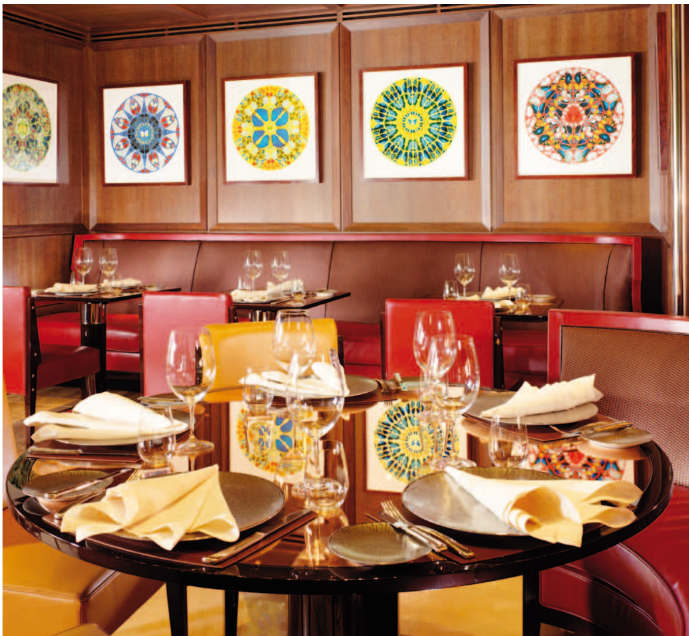
Ristorante Cut 45, caratterizzato da colori caldi e da un ambiente raffinato e accogliente. Le sale sono personalizzate dalle opere di Damien Hirst