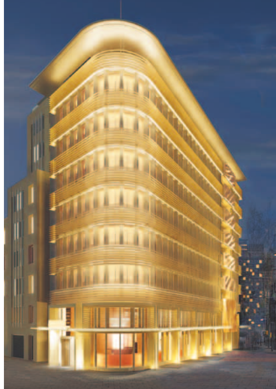
Nove piani in altezza caratterizzati in esterno da vetro, legno e acciaio con eleganti Brise-soleil, che controllano in modo mirato la luce solare in entrata e che avvolgono e sembrano contenere la facciata

Il 45 Park Lane si sviluppa per nove piani su un lotto dall'impianto trapezoidale con 45 camere e suite di lusso affacciate sullo splendido Hyde Park e un ristorante aperto a tutte le ore, diretto da Wolfgang Puck, ristoratore di fama internazionale insignito di premi e riconoscimenti a livello mondiale. Il restyling della struttura è stato curato dal famoso architetto Thierry Despont che, con il suo inconfondibile stile progettuale, ha disegnato sia gli interni sia gli esterni, con una precisione al dettaglio e con una realizzazione "tutto su misura". Non manca anche un'attenzione particolare all'approccio ecosostenibile, gli esterni sono infatti attrezzati con pannelli fotovoltaici per una produzione pulita dell'energia elettrica, in aiuto, soprattutto agli impianti di climatizzazione. I prospetti sono inoltre caratterizzati da una sorta di eleganti brise-soleil in acciaio, che controllano in modo mirato la luce solare in entrata e che avvolgono e sembrano contenere la facciata