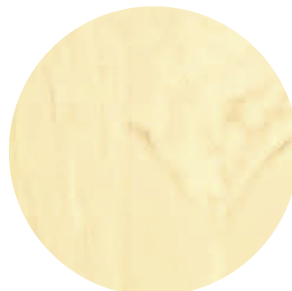
Marmo chiaro con venature