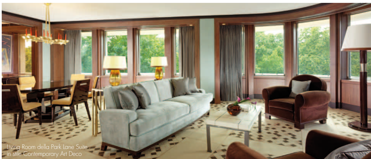
Living Room della Park Lane Suite in stile Contemporary Art Deco