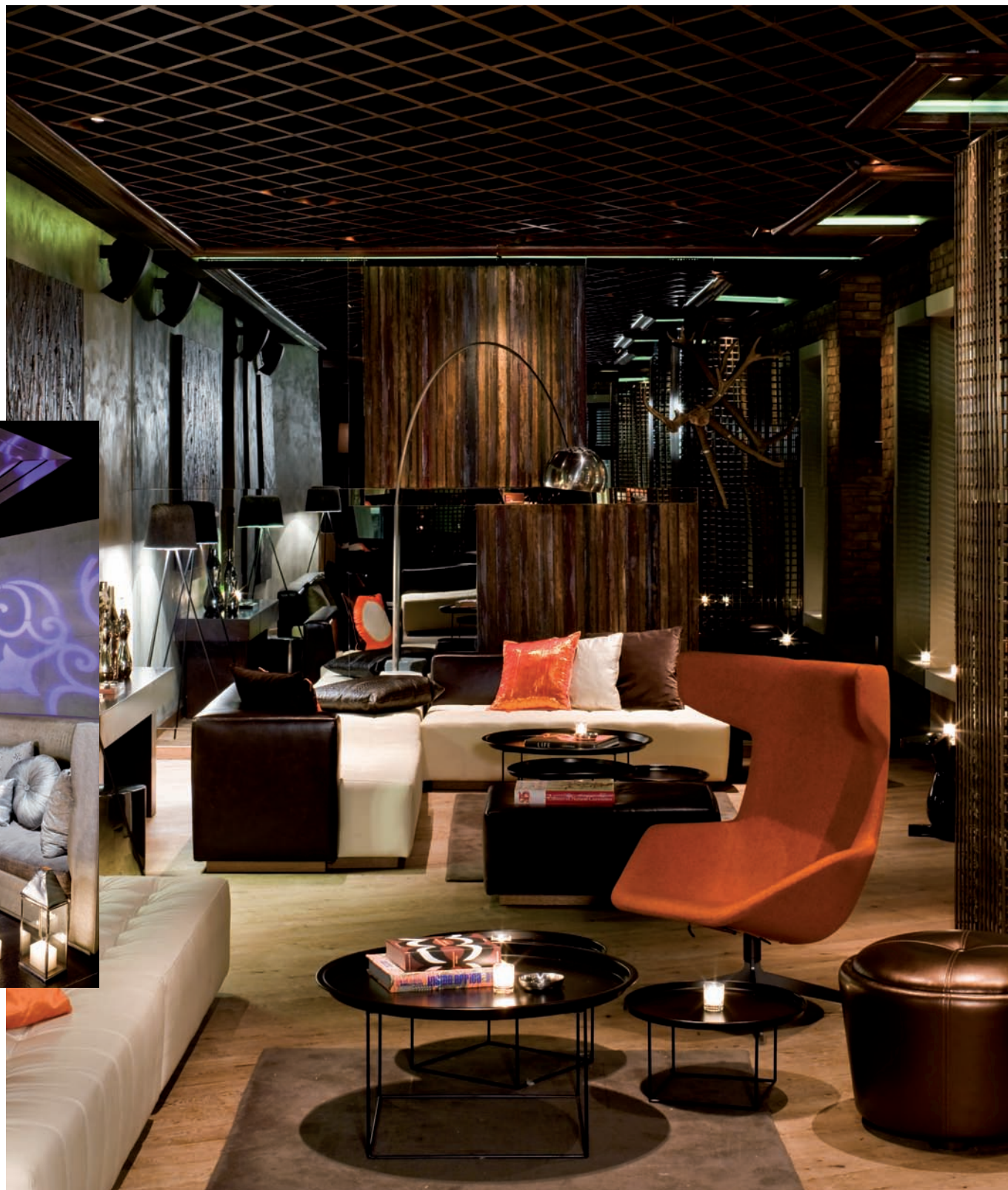
La W Living Room Experience, con pezzi di design italiano

The W Living Room Experience, with pieces of Italian