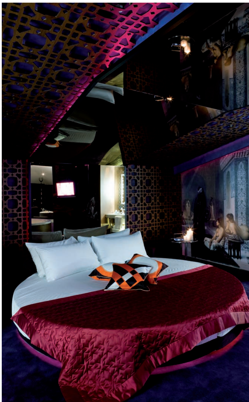
Extreme WOW®, la suite a due camere con la favolosa vasca idromassaggio

Extreme WOW®, the two-room suite with a fabulous hydromassage bath