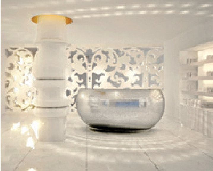
Nella Spa Agua il bancone in mosaico di specchi, illumina e diffonde bagliori in tutta la sala

Sempre rievocando la favola dei fratelli Grimm in cui, quando la principessa si addormenta, il Castello viene circondato da una foresta di rovi spinosi, il designer ha creato un labirintico insieme di lussureggianti giardini che “proteggono” e ornano la costruzione. Si entra in un mondo