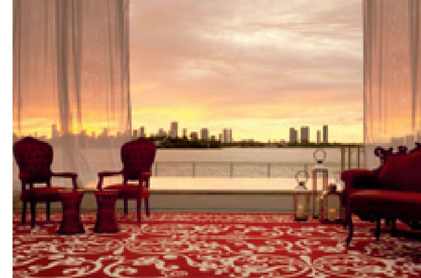
La Sunset Lounge, uno spazio indoor/outdoor, esclusiva destinazione per guardare il tramonto sullo skyline di Miami

In the Lobby there is an enormous picture of a child's face with the surprised expression of a present-day Alice who has just stepped into “Wonderland”