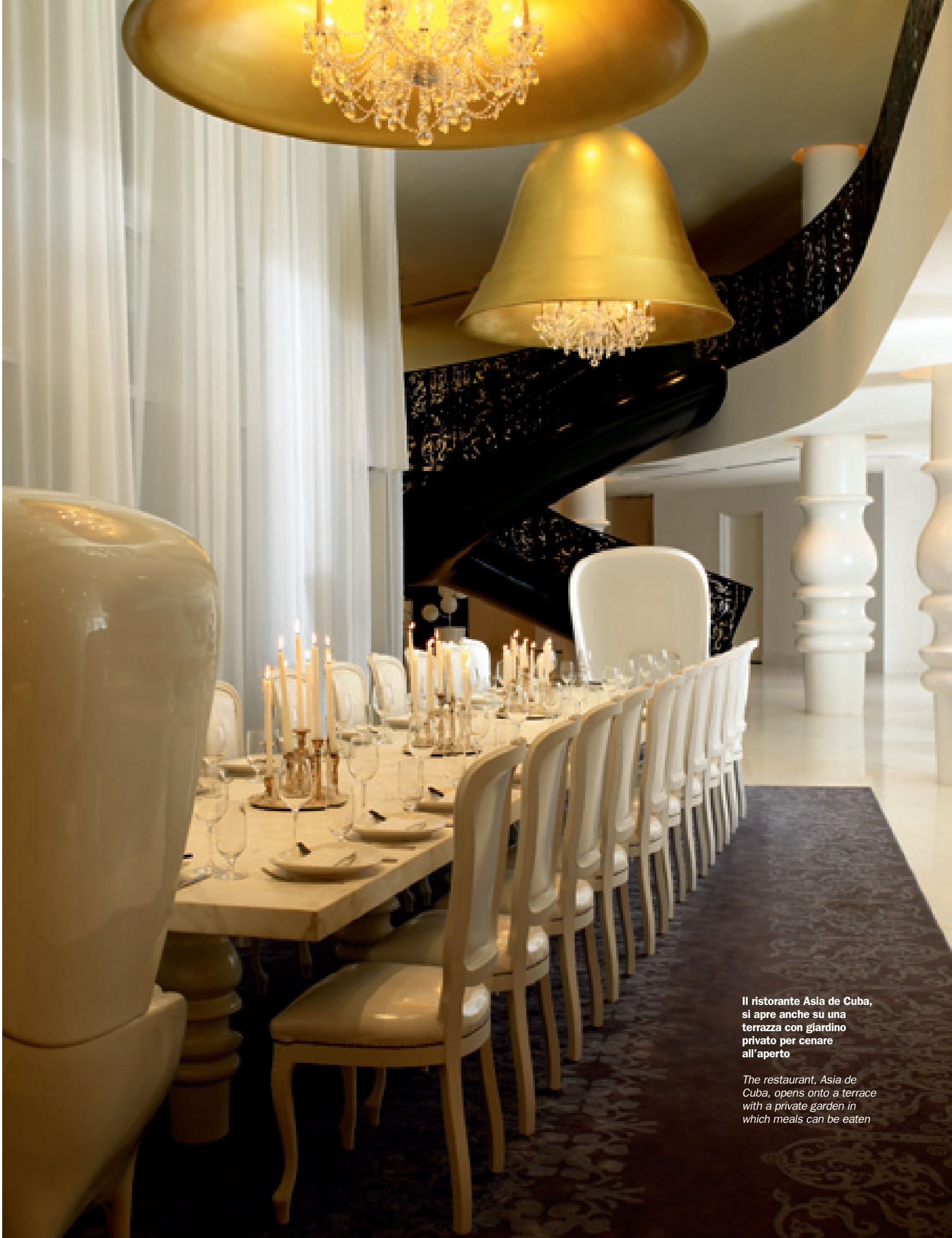
Il ristorante Asia de Cuba, si apre anche su una terrazza con giardino privato per cenare all'aperto

The Penthouse Suite, with a living-room area and a large terrace