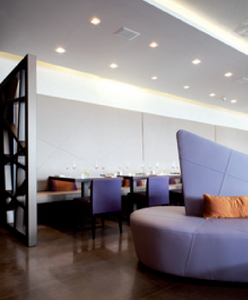
La sala interna è elegante e moderna, con abbinamenti cromatici di tendenza, elementi d'arredo originali e un attento studio delle luci

The space is separated into intimate areas, thanks to dividing leather sofas with very "glam" colours, just like the armchairs