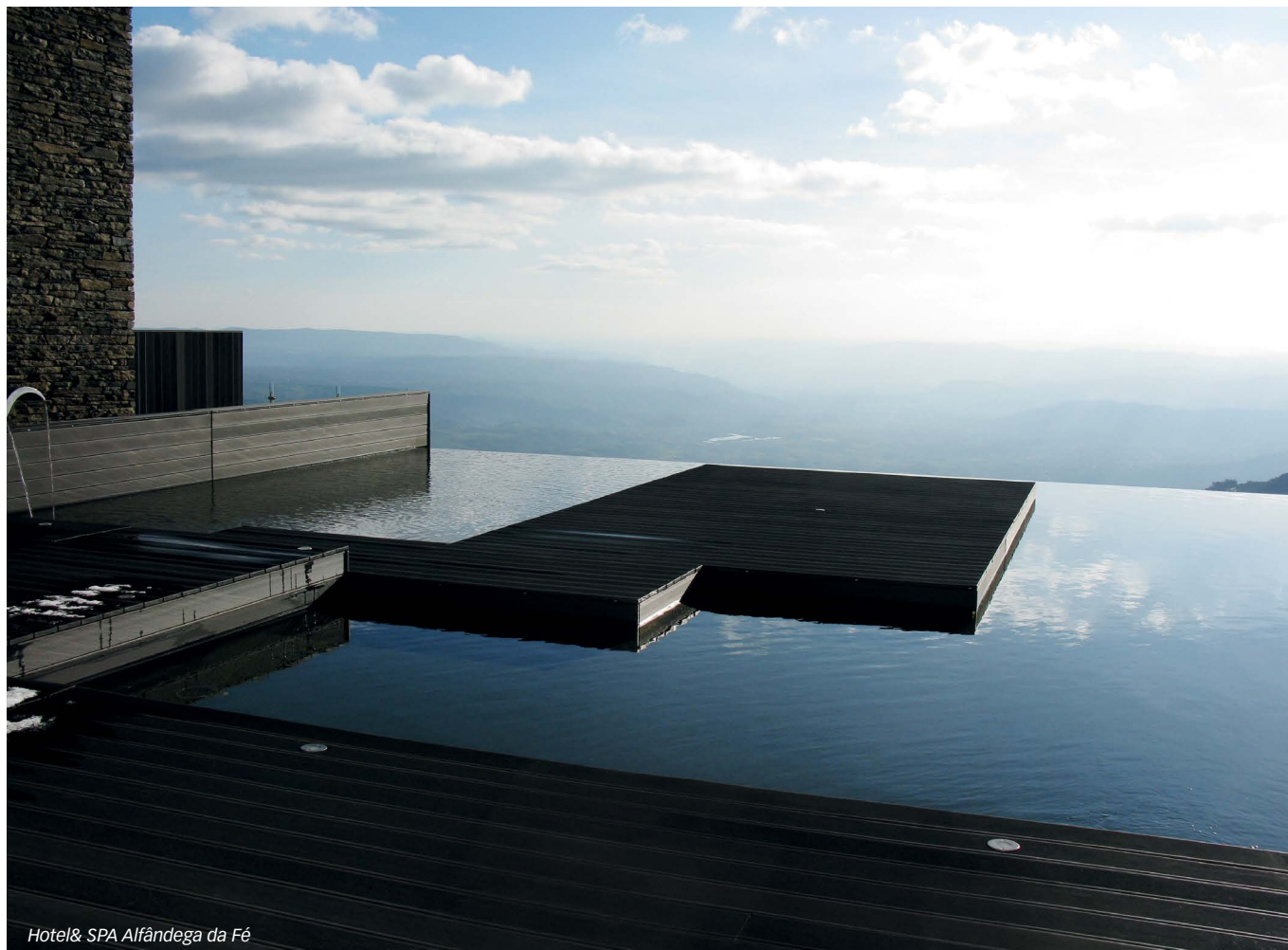
Hotel & SPA Alfândega da Fé